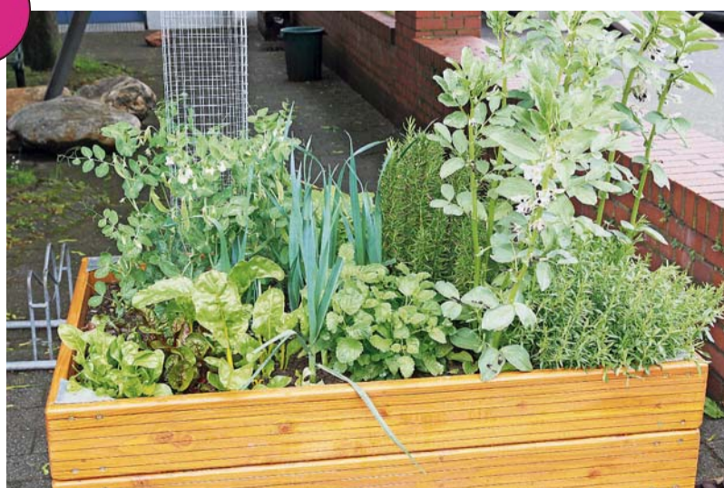
Hochbeet vor der Tufa Trier, Textorium: Hier wachsen Kräuter, ewiger Kohl, Mangold, dicke Bohnen, Zuckerkornbohne, Lauch und Steckzwiebeln.