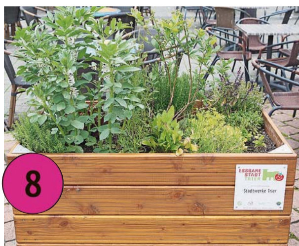
Hochbeet auf dem Viehmarkt, Stadtwerke: Hier wachsen Kräuter, roter Mangold, Kopfsalat und Heidelbeeren.