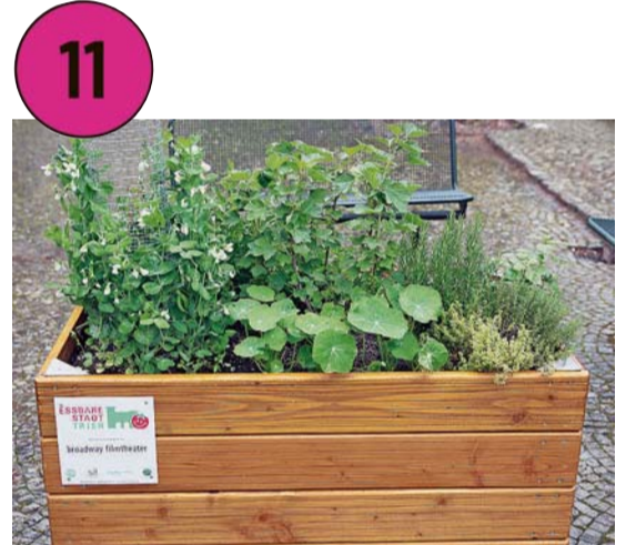
Hochbeet im Maarviertel, vor der Martinskirche, Broadway Filmtheater: Hier wachsen Kräuter, Kapuzinerkresse, Salat, Steckzwiebeln, Staudensellerie, Zuckerkornbohnen und Johannisbeeren.