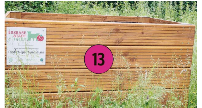
Hochbeet im Schulgarten des Friedrich-Spee-Gymnasiums: Diese Anlage ist öffentlich nicht zugänglich. Der Lokalen Agenda ist die Art der Bepflanzung nicht bekannt.