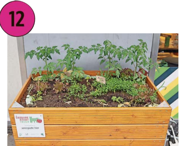
Hochbeet in der Paulinstraße, Unverpackt: Hier wachsen Tomaten, Salat, rote Bete, Kürbis, Linsen, Zwiebeln und Mönchspfeffer.