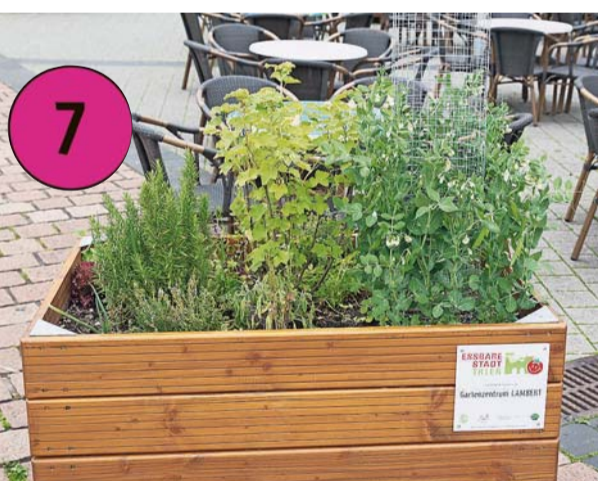
Hochbeet auf dem Viehmarkt, Gartenzentrum Lambert: Hier wachsen Kräuter, Kopfsalat, Johannisbeeren, Zuckerkornbohnen, Fenchelnollen, Rucola und Lauch.