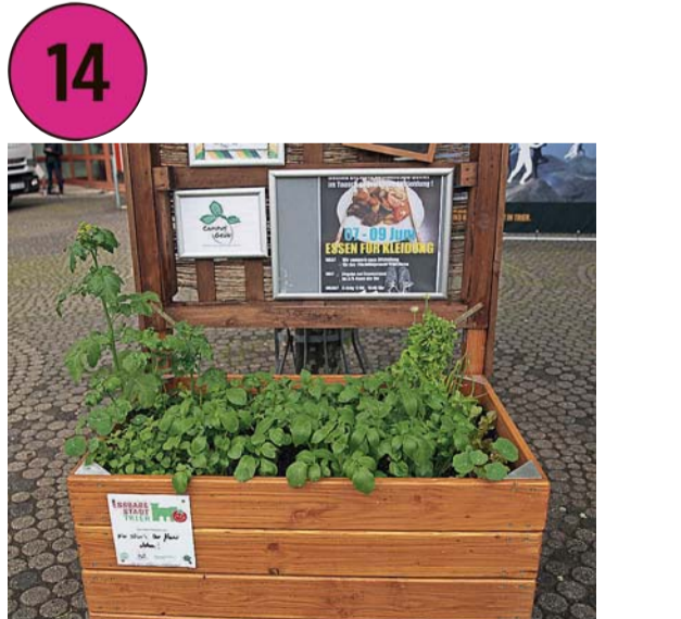
Hochbeet Uni Trier, Hochschulgruppe Campus Grün: Mit welchen Pflanzen das Beet bestückt ist, ist der Lokalen Agenda Trier leider nicht bekannt.