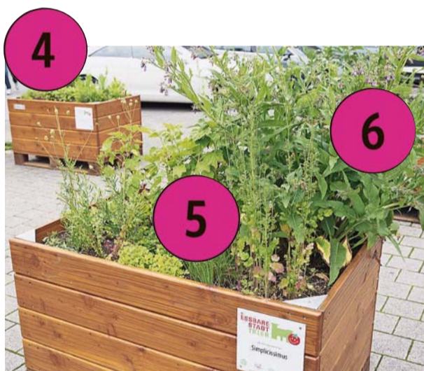
Drei Hochbeete auf dem Viehmarkt, Simplicitas: Hier wachsen diverse Kräuter, Johannisbeeren, Heidelbeeren, Radishes, Mangold, Salate, dicke Bohnen, Steckzwiebeln.